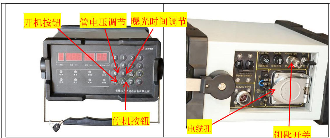
图9-1 常见X射线探伤装置控制箱