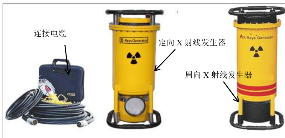
图 9-2 常见 X 射线探伤机外观图及连接电缆

X 射线发生器的核心部件是 X 射线管。X 射线管由阳极、阴极、灯丝、钨靶、铜体、发射罩等组成。X 射线管一端是作为电子源的阴极，另一端是嵌有靶材料的阳极。当两端加有高压时，阴极的灯丝热致发射电子。由于阴极和阳极两端存在电位差，电子向阳极运动，形成静电式加速，获取能量。具有一定动能的高速运动电子，撞击靶材料，产生 X 射线。典型的 X 射线管结构图见图 9-3。